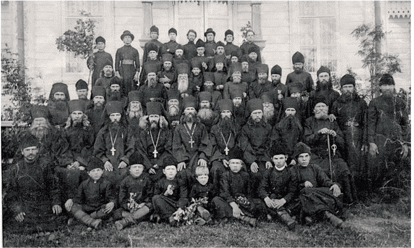
Уникальное фото 1902 года. Братия Яранского Пророчицкого монастыря

стро снял сапог, оторвал от портянки лоскут и перевязал мне руку.